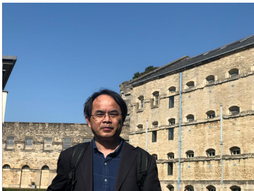
访问牛津大学纪念