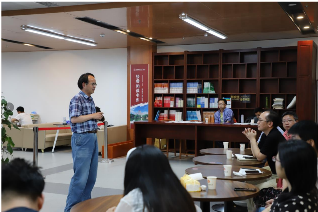
交流活动现场图四