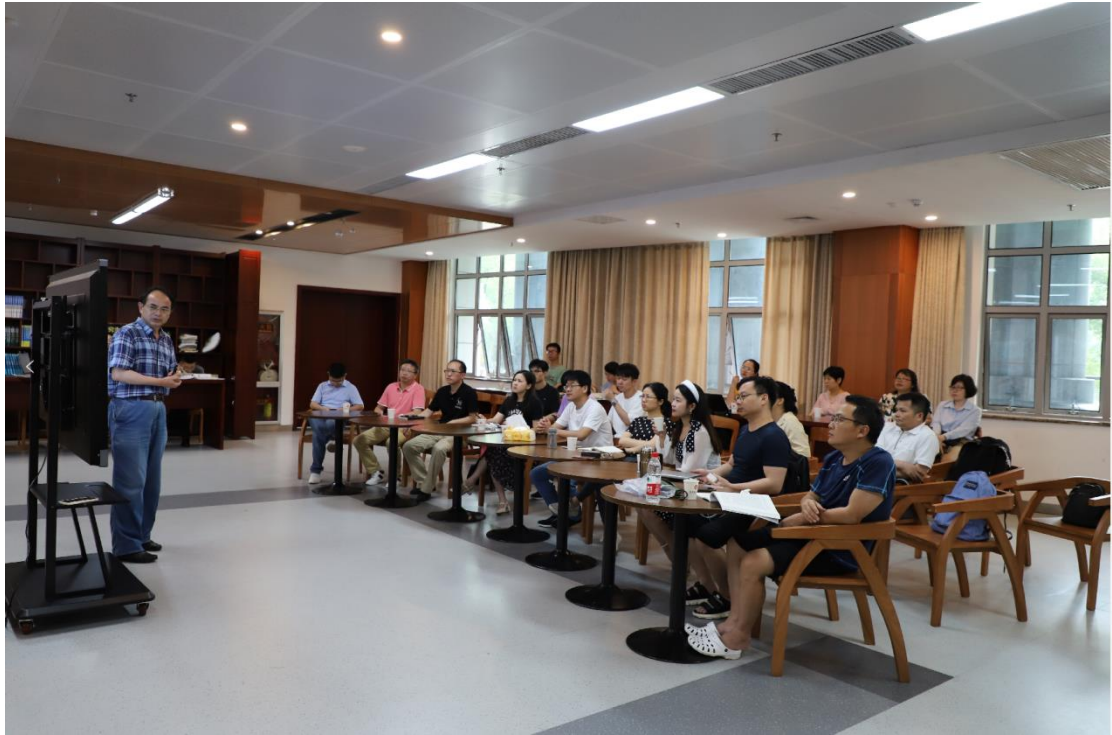
交流活动现场图三