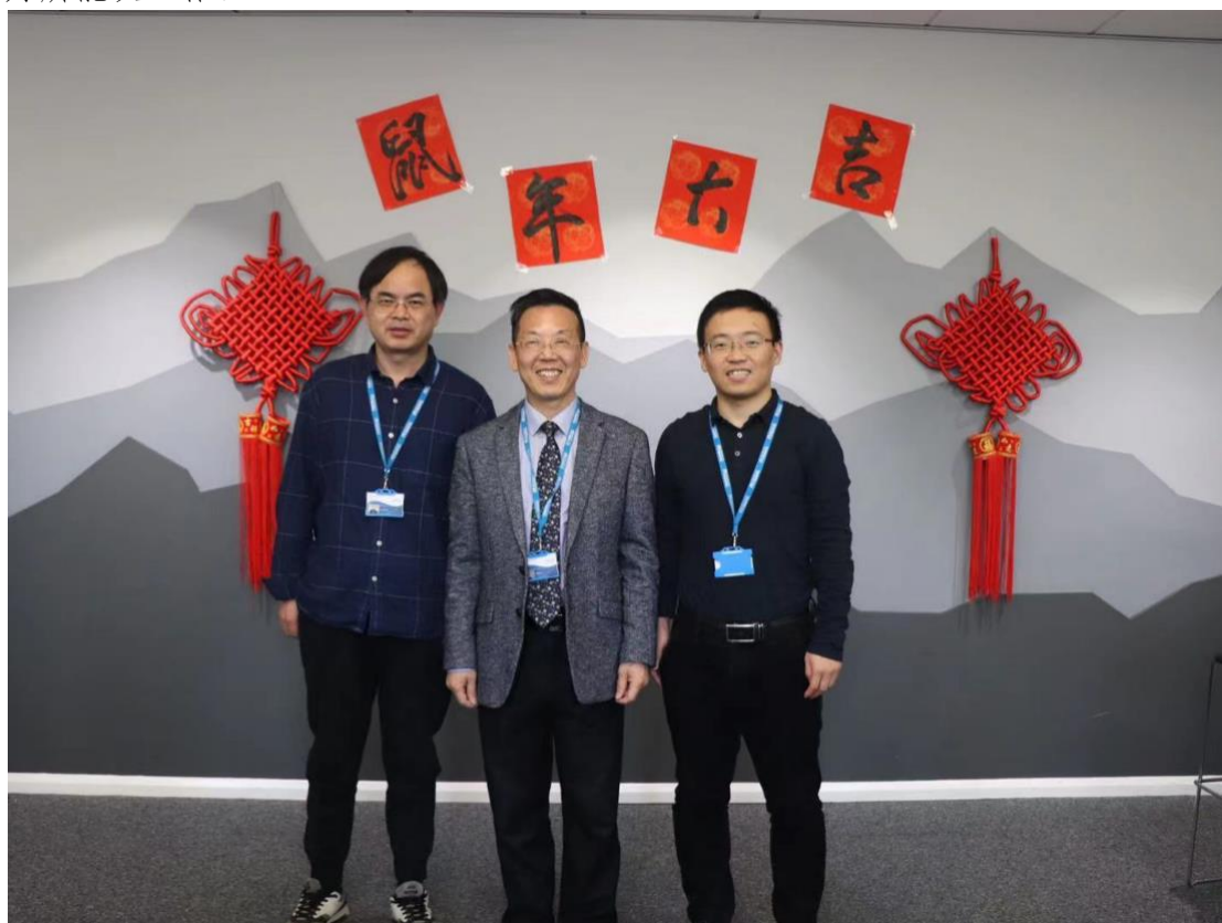
参加考文垂大学江西财经大学孔子学院新年活动