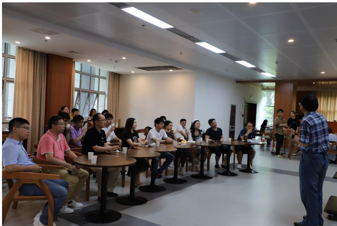
交流活动现场图五